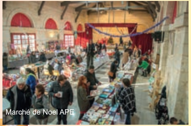
Marché de Noel APE