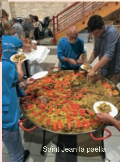
Saint Jean la paëlla