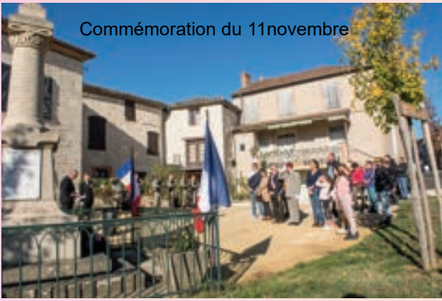
Commemoration du 11 novembre