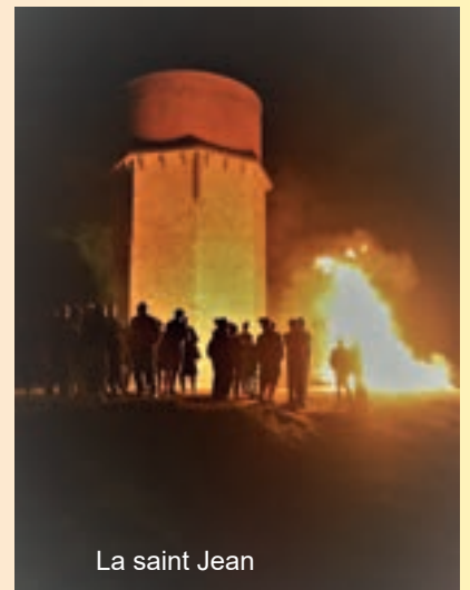
La saint Jean