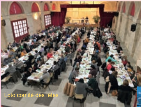
Loto comité des fêtes